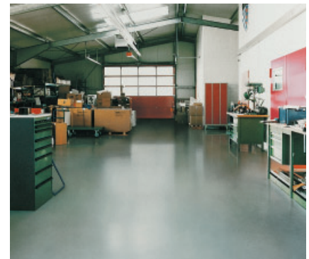
PCI Apoten-Beschichtung in einem Gewerbebetrieb mit hoher mechanischer und chemischer Belastung.